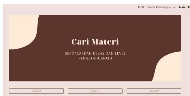
Gambar 6. Profil Pengembang Media Ecolearn

Pembuatan media ini memerlukan waktu kurang lebih selama 6 bulan sejak pengumpulan informasi awal dilaksanakan (bulan Agustus 2021). Revisi produk dilaksanakan mulai dari perbaruan logo, layout media, fitur-fitur menu dan tingkat efektivitas penggunaannya. Selain dari segi media, revisi juga dilakukan dari segi materi. Pada saat ujicoba lapangan, peneliti mengalami kendala pada bagian materi yang beberapa kurang lengkap sehingga harus melakukan peninjauan kembali materi dari kelas X, XI dan XII dengan mematok pada pembelajaran yang ada di SMA Lab UM.