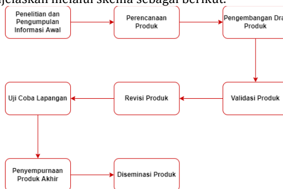
Gambar 1. Desain Penelitian Pengembangan Peneliti

Penelitian ini menggunakan metode penelitian dan pengembangan Research and Development (RnD) dalam prosesnya. Penelitian pengembangan (RnD) bertujuan untuk menghasilkan dan mengembangkan suatu produk sekaligus untuk mengatuhii keefektifan produk tersebut melalui pengujian. Penelitian ini mengadopsi penelitian Borg dan Gall. (Sugiyono, 2019). Beberapa modifikasi telah disesuaikan dengan kondisi peneliti (atas dasar kebutuhan di lapangan, keadaan yang sebenarnya terjadi, dan hal-hal lain) yang dijelaskan melalui skema sebagai berikut.