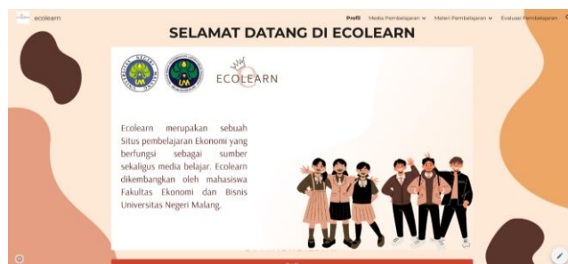
Gambar 4. Tampilan awal situs pembelajaran ecolearn

Tampilan awal pada saat membuka situs ecolearn adalah ucapan selamat datang dan tombol profil untuk menunjukkan profil pengembang sekaligus akun media sosial pendukung (gambar 5). Kemudian pada (gambar 6), dijelaskan pula urutan materi berdasarkan kompetensi dasar sesuai dengan kementerian pendidikan. Materi-materi yang disajikan mengalami beberapa kali revisi mulai dari revisi bobot materi hingga pengujian pada ahli materi dan respon siswa terhadap kemenarikan materi. Media ini juga dilengkapi dengan berbagai ruang seperti pengumpulan video pembelajaran, materi pembelajaran, ringkasan pembelajaran hingga disajikannya evaluasi pembelajaran.