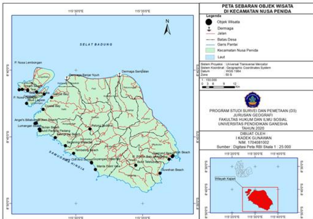
Gambar 1. Peta Sebaran Objek Wisata di Kecamatan Nusa Penida

yang ditentukan. Proses mark koordinat akan terekam pada GPS. GPS akan merekam titik-titik sebaran tingkat potensi objek wisata ketika melakukan mark/pengambilan data. Dari 25 sebaran tingkat potensi objek wisata di Kecamatan Nusa Penida yang tersebar di berbagai daerah di Nusa Penida, Desa Sakti memiliki lokasi objek wisata paling banyak sedangkan Desa Klumpu dan Desa Batumadeg hanya memiliki 1 lokasi objek wisata. Selain itu terdapat beberapa desa yang masih belum memiliki objek wisata yaitu Desa Ped, Kutampi Kaler, Kutampi, Batununggul, Suana dan Desa Sekartaji.