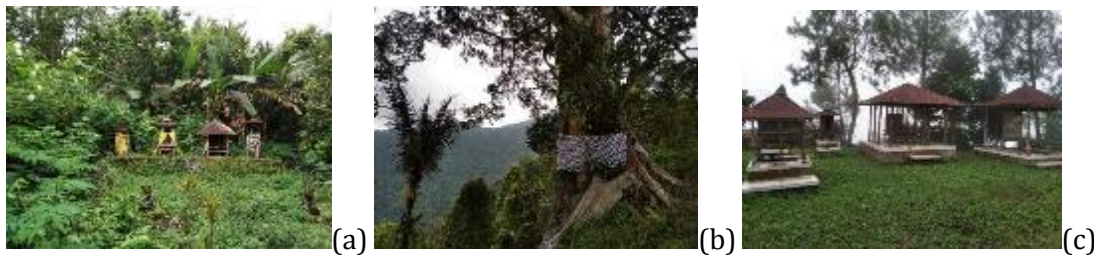
Gambar 2. Objek suci sepanjang jalur Bukit Cemara Geseng via Desa Silangjana, (a) Sanggah, (b) Pelinggih Pohon Besar, (c) Pura.

9094688 berbentuk sebuah Sanggah, 2) Koordinat UTM Zona 50S 296901 - 9094495 berbentuk Pohon Pelinggih besar, 3) Pada Koordinat UTM Zona 50S 297798 - 9093887 Pura puncak Bukit Cemara Geseng.