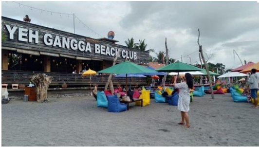
Gambar 1. Salah satu aktifitas wisata di Pantai Yeh Gangga, Tabanan

Potensi sosial budaya yang ada di Wilayah Pesisir Pantai Yeh Gangga dapat dilihat dari adanya lembaga masyarakat yang aktif dan berperan dibidangnya masing-masing. Kelembagaan masyarakat yang ada di wilayah pesisir Pantai Yeh Gangga yaitu; (1) Subak, (2) Kelompok Nelayan, (3) Desa Adat/Pekraman, dan (4) Banjar Adat. Selain kelembagaan masyarakat, potensi sosial budaya yang terdapat di wilayah pesisir Pantai Yeh Gangga yaitu adanya aturan/awig-awig berupa perarem. Perarem yang ada di wilayah pesisir Pantai Yeh Gangga merupakan perarem yang dikeluarkan oleh Desa Adat/Pekraman Yeh Gangga yang bertujuan untuk menjaga keselarasan antara aktivitas sosial budaya, aktivitas konservasi penyu, dan aktivitas pariwisata yang ada di Pantai Yeh Gangga. Perarem yang dikeluarkan oleh Desa Adat Yeh Gangga diantaranya yaitu pelarangan untuk mengambil pasir, membuang sampah sembarangan, pelarangan kepada wisatawan untuk memasuki beberapa kawasan yang disucikan, serta pelarangan untuk wisatawan berkunjung pada malam hari. Selain kelembagaan masyarakat dan adanya aturan/awig-awig, potensi sosial budaya yang terdapat di wilayah pesisir Pantai Yeh Gangga yaitu adanya tradisi/kebudayaan yang masih berjalan. Adapun tradisi dan kebudayaan yang terdapat di wilayah pesisir Pantai Yeh