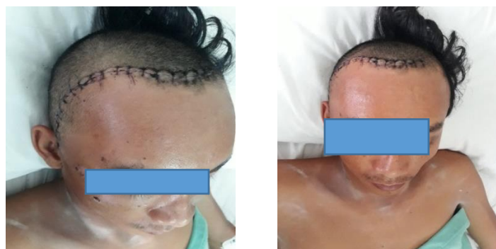
Gambar 2. Foto Pasien Post Operasi Kraniotomi Evakuasi C/ot dan Osteoplasti

IWL (dalam 24 jam tanpa kenaikan suhu) = 15cc x kgBB = 15 cc x 60 kg = 900 cc/24 jam Osm = osmolalitas, CM = cairan masuk, IWL = Insensible Water Loss, BC = balance cairan