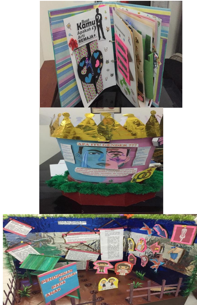
Gambar 2. Hasil Media BK

Berdasarkan diskusi yang dilaksanakan setelah kegiatan pendalaman dan pelatihan media BK terlihat bahwa para guru BK memahami akan pentingnya pendidikan seksual pada peserta didik dengan pemanfaatan media BK. Hal ini disebabkan bahwa jam masuk kelas BK sangat minim di sekolah. Media-media yang dihasilkan dalam bentuk media kreatif dapat memberikan pemahaman bagi peserta didik tentang pendidikan seks sejak usia dini dan dapat mencegah perilaku yang merugikan bagi peserta didik dan lingkungan sekitarnya.