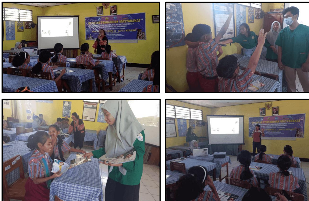
Gambar 3. Aktivitas pada Kegiatan Edukasi Penyakit Zoonosis Rabies di SDK Santo Yoseph II, Kota Kupang

Tahap terakhir dari rangkaian kegiatan edukasi ini adalah tahap evaluasi dimana pada tahapan ini dilakukan komunikasi dengan sekolah sehubungan dengan pelaksanaan kegiatan yang sudah dilaksanakan. Pada kegiatan ini respon atau umpan balik dari sekolah sebagai stakeholders untuk melihat efektivitas maupun keberhasilan dari kegiatan yang dilaksanakan. Pada kegiatan ini dilihat lagi setiap komponen kegiatan yang dilaksanakan apakah sudah memenuhi tujuan yang ingin dicapai oleh kegiatan edukasi, efektivitas teknik penyampaian materi, kompetensi pemateri, kompleksitas materi yang diberikan dan jalannya kegiatan secara keseluruhan. Pada tahap ini juga dilakukan komunikasi dengan sekolah sehubungan dengan peluang-peluang kolaborasi dan kerja sama yang dapat dilakukan untuk bersama-sama menyelesaikan tantangan maupun masalah-masalah yang ada di sekolah maupun masyarakat yang sekiranya dapat dibantu atau difasilitasi oleh pihak universitas.