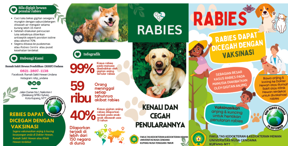
Gambar 2. Beberapa Contoh Media yang Digunakan dalam Kegiatan Edukasi

Pada tahap persiapan ini dilakukan berbagai kegiatan yang berhubungan dengan penyiapan pelaksanaan mulai dari pematangan rencana kegiatan dan sekolah yang menjadi target kegiatan, tahap komunikasi dan koordinasi dengan pihak sekolah untuk menginformasikan jenis dan tujuan kegiatan, target peserta serta jadwal pelaksanaan kegiatan. Pada tahap ini juga dilaksanakan persiapan media yang akan digunakan maupun materi-materi yang akan dibagikan ke peserta. Pada tahap ini pula, tim pengabdian kegiatan masyarakat menyiapkan peralatan maupun fasilitas yang akan mendukung pelaksanaan kegiatan edukasi. Pada tahap ini semua presentasi, video edukasi, flayers , leaflet dan buku disiapkan pada Gambar 2.