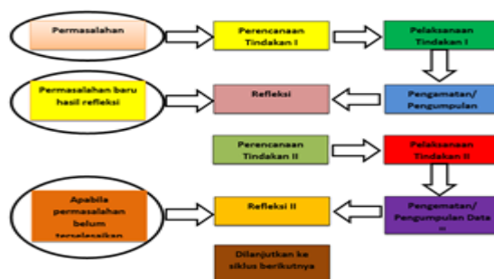
Gambar 1. Alur Penelitian Tindakan Kelas (dalam Suharsimi Arikunto, 2006)

Tempat pelaksanaan penelitian ini adalah di SMP Negeri 2 Kerambitan. Penelitian dilaksanakan mengikuti siklus. Rancangannya sebagai berikut: