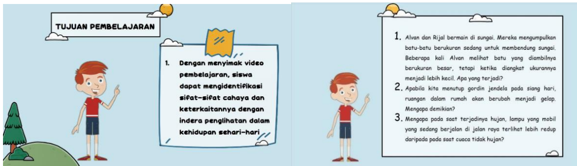
Gambar 3. Hasil Revisi Video Berbasis PowToon