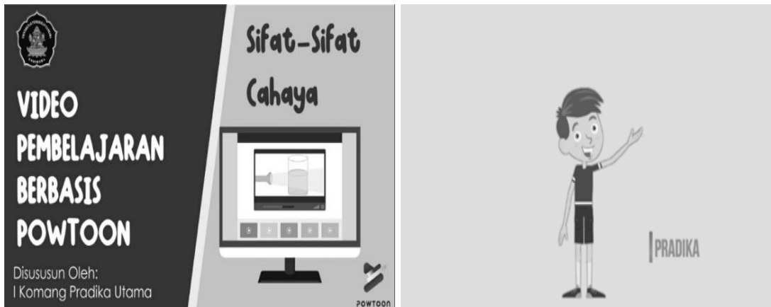
Gambar 1. Rancangan Video Berbasis PowToon

Ketiga, pengembangan. Tahap ini mengembangkan Video Berbasis PowToon. Pada video terdiri dari lima bagian yaitu opening , isi, evaluasi, kesimpulan dan penutup. Pada opening berisikan logo, judul, pengembang. Selain itu menyajikan dubbing yang menarik. Pada bagian isi menyajikan materi materi sifat-sifat cahaya yang diperjelas dengan dubing. Pada bagian evaluasi, berisikan evaluasi untuk menguji pemahaman siswa. dan pada kesimpulan berisikan kesimpulan pembelajaran, dan pada Closing menyajikan penutup. Hasil dari pengembangan disajikan pada Gambar 2.