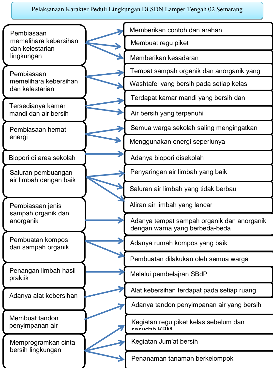
Gambar 1. Bagan Pelaksanaan Karakter Peduli Lingkungan

Berdasarkan gambar diatas dapat dijelaskan bahwa pelaksanaan karakter peduli lingkungan di SDN Lamper Tengah 02 ditemukan bahwa guru memberikan contoh dan arahan, membuat regu piket dan memberikan kesadaran kepada siswa dalam pembiasaan memelihara dan melestarikan lingkungan sekolah. Disekoalh juga terdapat tempat sampah organik dan