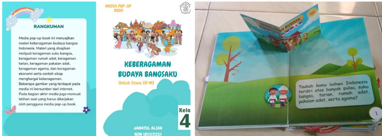
Gambar 2. Media Pembelajaran Pop-Up Book yang Dikembangkan

book terdiri atas cover depan dan cover belakang. Cover depan memuat judul media, logo Undiksha, gambar pendukung, judul materi, kelas dan identitas pengembang. Sedangkan pada cover belakang memuat rangkuman dari media yang dikembangkan. Kompetensi Dasar dan indikator, tujuan pembelajaran, petunjuk penggunaan media termuat pada halaman pertama media pop-up book. Bagian isi memuat materi keberagaman budaya pada tema 1 subtema 1 kelas IV Sekolah Dasar. Setiap halaman disusun dengan menarik dan disesuaikan dengan tema. Bagian isi terdapat pada halaman 1 sampai dengan halaman 13. Pada halaman 14 terdapat latihan soal dan kunci jawaban. Pada halaman 14 merupakan halaman terakhir pada media pop-up book, halaman ini memuat latihan soal dan kunci jawaban. Adapun hasil pengembangan media disajikan pada Gambar 2.