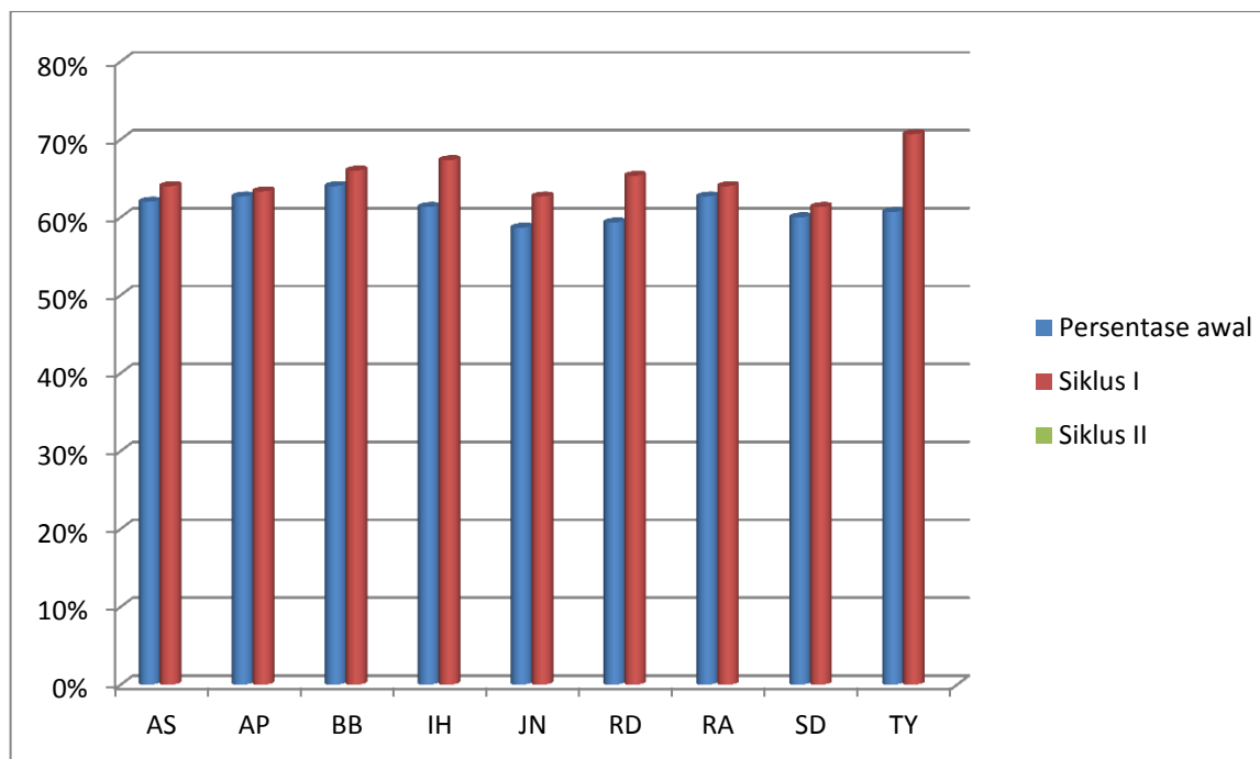
Gambar 1 Grafik Persentase Peningkatan Motivasi Belajar Siswa Siklus I

Berikut ini akan disajikan grafik peningkatan motivasi belajar siswa siklus I.