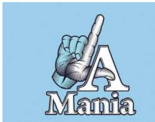
Gambar 4. Logo LA Mania

Dalam perkembangannya LA Mania juga tidak hanya menggunakan logo Joko Tingkir pada atribut mereka. Mereka juga mempunyai logo dengan gambar tangan membentuk huruf “L” kemudian disambung dengan huruf “A”. Logo tangan berbentuk LA ini kemudian menjadi identitas logo kelompok suporter mereka. Logo gambar tangan ini juga banyak digunakan pada atribut baik kaos, syal, giant flag, Kartu Tanda Anggota , maupun spanduk-spanduk mereka.