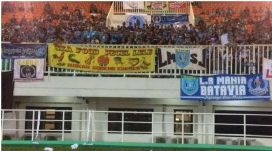
Gambar 2. Spanduk Pecel Lele Saat Pertandingan Persela

Semenjak Persela bermain di Liga tertinggi Indonesia, Persela mampu membangkitkan rasa percaya diri masyarakat Lamongan akan identitas asal mereka. Rasa percaya diri itu tidak hanya ada pada jiwa masyarakat yang berdomisili di Lamongan. Tapi juga merasuk ke jiwa seluruh masyarakat Lamongan di perantauan. rasa percaya diri akan identitas asalnya tergambar dari cara mereka yang tidak segan mencantumkan nama Lamongan di tempat mereka berjualan Ketika Persela bertanding di luar pulau, disetiap pelosok negeri ini selalu ada suporter Persela yang mendukung secara langsung ke stadion. Mereka adalah masyarakat Lamongan yang berada di perantauan. Bahkan menjadikan sebuah tradisi dan budaya bagi suporter Persela yang ada di tanah rantau untuk bisa melakukan penyambutan dari bandara dan jamuan makan bersama antar suporter dan kesebelasan Persela saat bertandang ke daerah perantauan mereka. Mulai dari anak-anak baik yang muda maupun yang tua, perempuan atau laki-laki membaur jadi satu untuk melakukan penjamuan. Sebuah tradisi yang hanya ditemui dan dilakukan oleh suporter Persela.