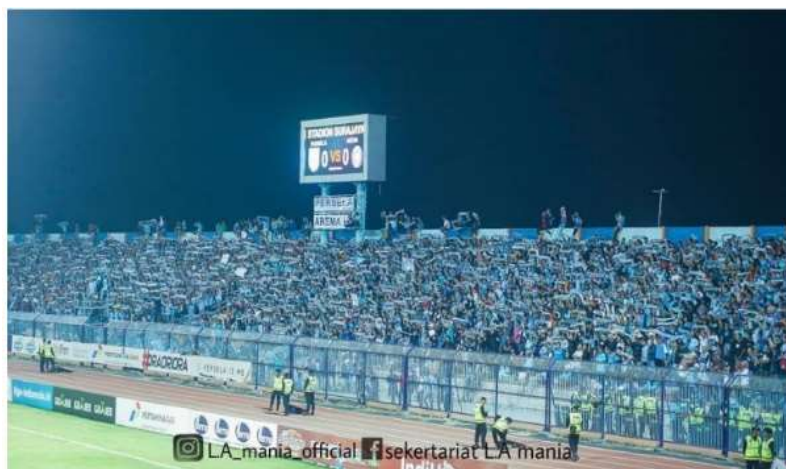
Gambar 5. Dominasi warna biru muda di stadion

“Dari dulu awalnya terbentuknya LA Mania Atribut LA Mania berwarna biru muda karena kostum Persela kan berwarna biru muda. Pada saat persela main di kandang atau saat kita melakukan tour ke luar kota, ke stadion tim lain. Mayoritas anggota kelompok suporter LA Mania dominan menggunakan kaos berwarna biru muda dengan tulisan persela ataupun LA Mania, saya kalau nonton ke stadion juga menggunakan kaos La Mania”. (Septya Nugraha, 2019)