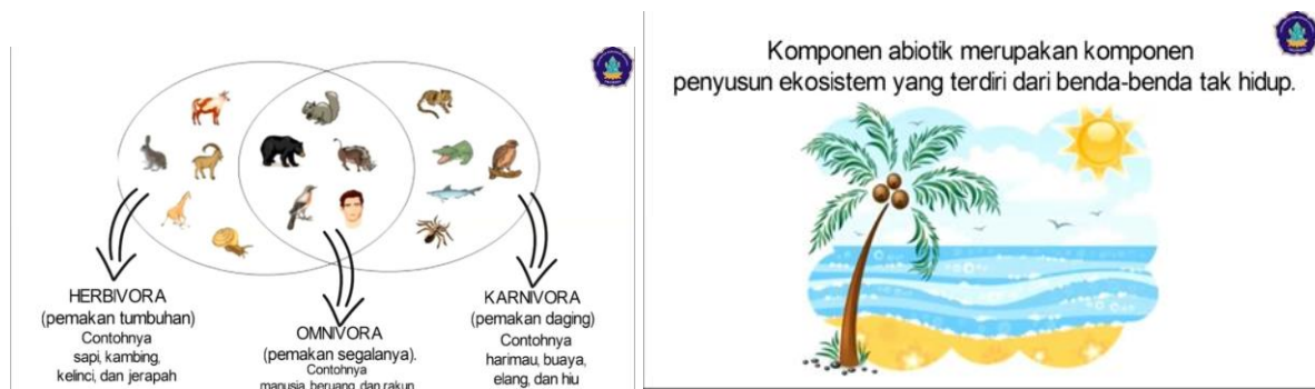
Gambar 3. Hasil Revisi Media Video Pembelajaran

Berdasarkan hasil masukan yang diberikan oleh para ahli, uji coba perorangan dan uji coba kelompok kecil, maka dilakukan revisi produk untuk menyempurnakan produk video pembelajaran yang dikembangkan agar menjadi lebih baik. Adapun hasil revisi yang dilakukan disajikan pada Gambar 3 .