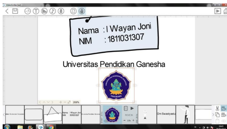
Gambar 2. Perancangan Komponen Video Pembelajaran

Penyusunan Rencana Pelaksanaan Pembelajaran (RPP) digunakan untuk mengarahkan siswa dalam kegiatan pembelajaran. Dengan adanya RPP membuat pembelajaran menjadi tersusun sistematis dengan baik. Adapun Rencana Pelaksanaan Pembelajaran (RPP) Kelas V tema 5 subtema 1. Adapun desain tampilan yang dibuat dalam video pembelajaran ini menggunakan aplikasi videoscabe , disajikan pada Gambar 2 .