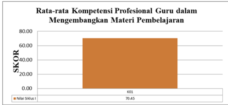
Gambar 1. Grafik Rata-rata Kompetensi Profesional Guru dalam Mengembangkan Materi Pembelajaran pada Siklus 1

Pada Gambar 1 terlihat skor rata-rata kompetensi profesional guru dalam mengembangkan materi pembelajaran dan bahan ajar sebesar 70,45 dengan kriteria cukup. Hal ini menunjukkan bahwa kemampuan guru dalam mengembangkan materi pembelajaran dan bahan ajar setelah diterapkan pendekatan supervisi kolaboratif sudah cukup baik. Berbeda dengan sebelum diterapkan pendekatan supervisi kolaboratif, rata-rata kompetensi guru dalam mengembangkan materi pembelajaran dan bahan ajar sebesar 52,27 dengan kriteria kurang. Hal ini menunjukkan bahwa pendekatan supervisi kolaboratif dapat meningkatkan kompetensi profesional guru dalam mengembangkan materi pembelajaran dan bahan ajar.