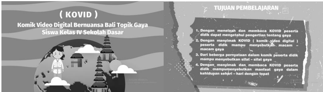
Gambar 1. Rancangan media KOVID

Ketiga, pengembangan. Tahap ini dilakukan pengembangan media KOVID. Tampilan pembuka media pembelajaran dilengkapi judul materi, dan tujuan. Media ini dilengkapi dengan pembahasan mengenai materi gaya. Pada materi ini terdapat pada tema 5 kelas IV sekolah dasar. Isi media pembelajaran dapat dilihat pada pada Gambar 3 .