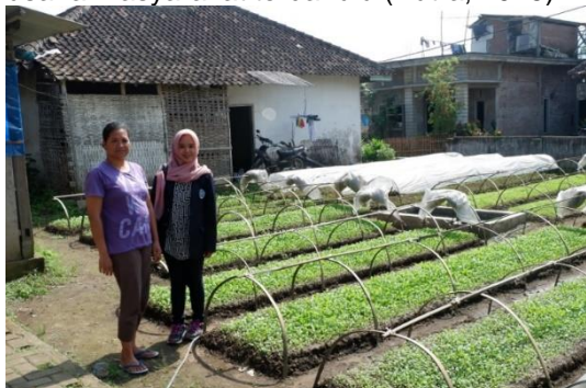
Gambar 3. Petani kebun bibit mitra BUMDes Ageng

BUMDes yang ditetapkan oleh pemerintah desa adalah Program Jalin Matra, program pinjaman usaha kecil, tabungan umum, pinjaman usaha bibit (gambar 3), tabungan hari raya, arisan sembako, deposito. Pinjaman Usaha Bibit (PUB) terfokus pada petani yang sesuai dengan potensi wilayah. Untuk menentukan unit usaha dan rancangan alternatif klarifikasi jenis usaha juga dirumuskan bersama masyarakat desa yang sesuai dengan potensi wilayah dan usaha masyarakat terdahulu (Putra, 2015).