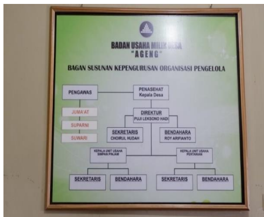
Gambar 1 Bagan pengurus BUMDes Ageng

Tujuan berdirinya BUMDes Ageng adalah meningkatkan perekonomian di Desa Ngroto serta menciptakan perubahan sosial yang lebih baik bagi masyarakat Desa Ngroto. Hal tersebut sejalan dengan visi BUMDes Ageng yaitu menuju masyarakat yang mandiri dan sejahtera. Sedangkan misi BUMDes Ageng sendiri yaitu, 1) menggali potensi ekonomi desa, 2) meningkatkan peran UKM dan usaha kecil lainnya untuk memperbesar kesempatan kerja dan berusaha, 3) menciptakan akses permodalan yang mudah dan murah, 4) membangkitkan kegiatan ekonomi kecil dan menengah yang berdaya saing, 5) menumbuh kembangkan usaha-usaha ekonomi di segala sektor, 6) menciptakan produk unggulan ekonomi desa sesuai dengan karakteristik desa, 7) menciptakan masyarakat desa yang sejahtera dan mandiri. Visi dan misi tersebut tercantum dalam dokumen BUMDes Ageng Desa Ngroto.