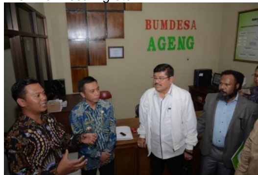
Gambar 2. Kunjungan dari Papua

Kemudian di tahun 2018 perkembangan akan kinerja BUMDes mulai terlihat baik karena semakin berkurangnya masyarakat miskin di Desa Ngroto.