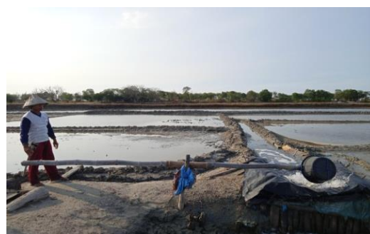
Gambar 4. Memindahkan air yang sudah tua ke lahan tambak

umur air laut 6 . Setelah lahannya selesai ditata baru dapat dialiri air yang ada di caren (penampungan air) dengan menggunakan eboran 7 . Air laut yang umurnya sudah tua akan dialirkan ke lahan yang kering, setelah itu ditunggu sampai menjadi garam. Proses pembuatan garam sendiri memerlukan waktu kurang lebih 20 hari dari mulai membenahi lahan sampai panen jika cuacanya itu panas, jika ada kendala seperti hujan maka waktu yang diperlukannya pun lebih lama.