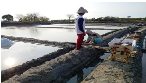
Gambar 3. Membenahi lahan tambak

Pada proses pembuatan garam secara tradisional diawali dengan membenahi lahan terlebih dahulu sebelum diisi air karena sebelumnya tambak garam biasanya digunakan sebagai tambak ikan. Pembenahan dilakukan dengan cara mengeringkan lahan kemudian memadatkan lahan menggunakan slender 3 , dan dihaluskan menggunakan usut 4 . Tujuannya agar lahannya menjadi padat sehingga ketika diisi dengan air laut tidak merembes. Pembenahan lahan sendiri dibutuhkan waktu satu hari sampai tiga hari baru dapat diisi air laut.