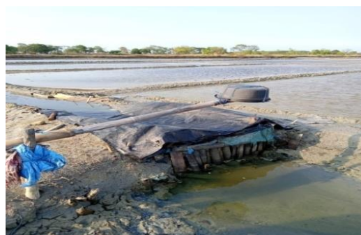
Gambar 1. Eboran , digunakan untuk memindahkan air dari caren ke tambak

menggunakan mesin atau peralatan canggih. Namun, mayoritas petani garam yang ada di Desa Dresi Kulon masih menggunakan alat-alat yang tradisional atau manual. Berikut gambar beberapa alat yang dipakai membuat garam secara tradisional di Desa Dresi Kulon.