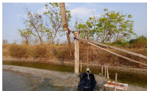
Gambar 2. Kincir angin , digunakan untuk mengalirkan air laut ke caren

Proses pembuatan garam baik secara tradisional maupun modern hampir sama, bedanya waktu yang diperlukan lebih cepat jika menggunakan alat yang sudah modern dibanding dengan menggunakan alat yang masih tradisional. Pembuatan garam dengan menggunakan alat yang masih tradisional para petani garam harus menghaluskan lahan terlebih dahulu. Sedang jika menggunakan alat yang modern para petani garam hanya perlu memadatkan saja lahannya tanpa harus menghaluskan, karena para petani menggunakan geoisolator yaitu alat berupa mejanan plastik. Adapun langkah-langkah yang dilakukan