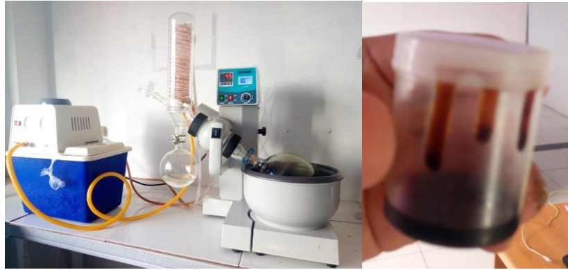
Gambar 3. Ekstrak kasar sarang lebah hasil rotary evaporator

Aroma cengkih disebabkan karena lokasi sarang tersebut berdekatan dengan perkebunan cengkih, sekitar 700 – 1000 m. Filtrat hasil maserasi sarang lebah dengan etanol 70 % selama 2 x 24 jam, berwarna kuning kecoklatan. Setelah pelarut diuapkan dengan Rotary Evaporator Buchi, diperoleh ekstrak kasar sarang lebah Apis dorsata Binghami dari Minahasa selatan hitam kecoklatan dengan bobot 50 gr. Ekstrak kasar beraroma khas sarang lebah, beraroma madu dan cengkih.