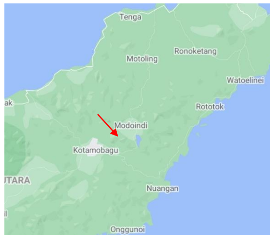
Gambar 2. Lokasi pengambilan sampel sarang lebah A. dorsata Binghami di perkebunan Desa Wulurmaatus, Kec. Modoinde, Minahasa Selatan.