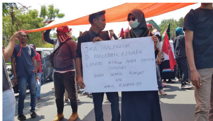
Jika malingnya di parlemen, kenapa lantas KPKnya anda minta ditutup! Anda wakil rakyat apa wakil rampok? (Kumparan, 26 September 2019 (Data 2))

Kritik adalah tanggapan terhadap suatu hasil karya, pendapat, dan lain sebagainya yang terkadang disertai dengan pertimbangan baik buruknya.. Data makna implikatur berupa kritikan dijelaskan sebagai berikut.