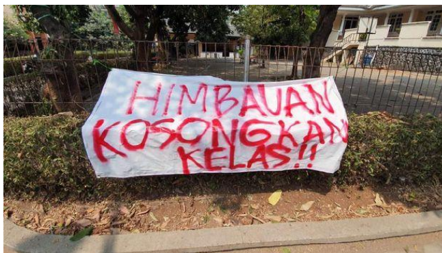
Himbauan kosongkan kelas!! (Detik, 24 September 2019 (Data 3))

Mengajak bertujuan untuk mengajak serta meminta pihak lain untuk mengikuti perintah yang diberikan. Mengajak dapat dilakukan dengan cara yang halus agar seseorang terbujuk untuk mengikutinya. Data makna implikatur berupa ajakan dijelaskan sebagai berikut.