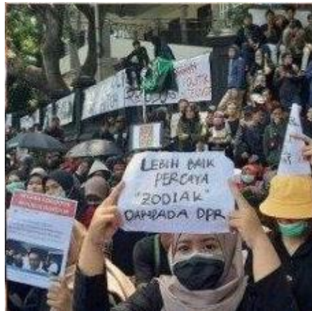
Lebih baik percaya zodiak daripada DPR (Tribunnews, 30 September 2019 (Data 1))

Konteks tuturan pada poster tersebut yaitu mahasiswa yang sudah tidak percaya lagi dengan DPR. Tuturan dalam poster tersebut menyatakan bahwa zodiak yang kebenarannya diragukan, lebih dapat dipercaya daripada DPR. Para anggota DPR yang ketika masa kampanye menggemborkan akan berpihak pada rakyat, kini justru melakukan yang sebaliknya. Rakyat yang menolak akan pengesahan RKUHP dan revisi Undang-undang KPK yang harusnya didengar, justru diabaikan oleh DPR, dan tetap ingin mengesahkan kedua kebijakan tersebut. Padahal RUU KUHP dan revisi Undang-undang KPK dinilai akan memeras rakyat dan tidak pro terhadap rakyat. Tuturan tersebut berupa sindiran kepada para anggota DPR yang seolah melupakan janji-janji yang mereka sampaikan pada masa kampanye. Sehingga membuat mahasiswa dan rakyat lebih percaya pada zodiak daripada DPR. Hal tersebut tercermin dalam kalimat “Lebih baik percaya zodiak daripada DPR”. Sindiran dalam wacana ini merupakan bentuk kritik yang disampaikan secara implisit oleh mahasiswa kepada DPR. Sindiran merupakan kritik yang disampaikan secara implisit dengan tujuan agar kritik yang disampaikan tidak terlalu kaku (Savitri, 2018: 18).