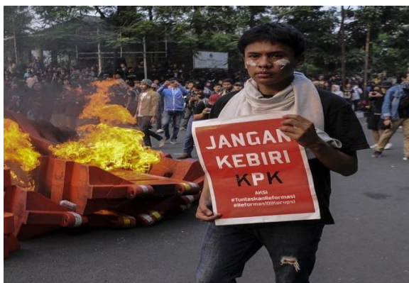
Jangan kebiri KPK (Tirto, 25 September 2019 (Data 7))

Tuturan tersebut berfungsi untuk melarang DPR dan presiden mengesahkan revisi Undang-undang KPK yang justru akan membuat KPK menjadi mati. Pengesahan tersebut merupakan salah satu bentuk pengebirian yang dilakukan oleh DPR dan presiden terhadap KPK. Revisi Undang-undang KPK dinilai sebagai upaya mencederai KPK yang dilakukan oleh DPR. Dalam poster tersebut disebut 'dikebiri' karena pasal-pasal yang terdapat dalam revisi Undang-undang KPK justru membuat KPK seolah dibunuh secara perlahan dengan menggerogoti sistem kerjanya yang dinilai sudah cukup baik. Dengan mengesahkan revisi Undang-undang KPK berarti DPR turut serta dalam upaya pengebirian terhadap KPK. Data tersebut merupakan fungsi deklaratif berupa larangan. Hal itu terlihat dari penanda gramatikal, yaitu penggunaan kata jangan pada kalimat di atas. Penggunaan kata jangan dalam kalimat itu berfungsi melarang.