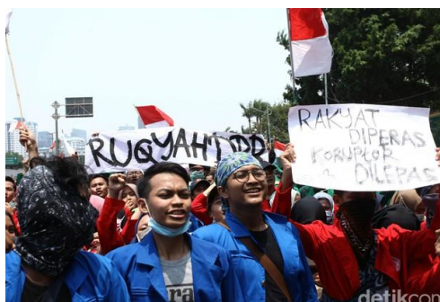
Rakyat diperas, koruptor dilepas. (Detik, 24 September 2019 (Data 8))

Fungsi ekspresif adalah bentuk tuturan yang berfungsi untuk menunjukkan sikap psikologis penutur kepada suatu keadaan yang dihadapi oleh mitra tutur, meliputi mengucapkan selamat, mengucapkan terima kasih, merasa ikut bersimpati, meminta maaf (Leech, 1983). Data fungsi implikatur berupa fungsi ekspresif dijelaskan pada paparan berikut ini.