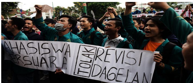
Mahasiswa bersuara, tolak revisi dagelan. (Tempo, 23 September 2019 (Data 4))

Fungsi asertif yaitu bentuk tindak tutur yang mengikat penutur pada kebenaran proposisi yang dituturkan, misalnya menceritakan, melaporkan, mengemukakan, menyatakan, mengumumkan, mendesak, meramalkan, menguatkan, dan membual (Leech, 1983). Data fungsi implikatur berupa fungsi asertif dijelaskan pada paparan berikut ini.