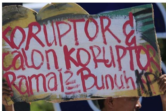
Koruptor dan calon koruptor ramai-ramai bunuh KPK. (Kompas, 25 September 2019 (Data 5))

Konteks tuturan poster mahasiswa tersebut yaitu revisi Undang-undang KPK yang bukannya memperkuat posisi KPK sebagai lembaga antirasuah, namun justru melemahkan KPK, hal ini tampak seperti dagelan. Tuturan dalam poster mahasiswa tersebut menunjukkan bahwa mahasiswa tidak bisa diam dengan sikap DPR yang mengesahkan revisi Undang-undang KPK. Undang-undang KPK ini dinilai dagelan karena isinya yang justru menunjukkan keberpihakan kepada para koruptor, bukan justru sebaliknya. Karenanya mahasiswa menolak revisi Undang-undang KPK yang seolah lawakan dan tidak nyata karena berpihak pada koruptor. Tuturan tersebut merupakan fungsi asertif berupa desakan dan pernyataan. Melalui aksi demonstrasi dan poster-poster yang memiliki fungsi asertif ini, maka mahasiswa telah menyampaikan aspirasi rakyat dan mampu memerankan perannya sebagai agent of change (Jiwandono, 2020: 161). Pernyataan tersebut ditandai dalam kutipan “Mahasiswa bersuara”. Mahasiswa mendesak DPR untuk tidak mengesahkan revisi Undang-undang KPK dan menyatakan penolakan mereka terhadap revisi tersebut yang seolah lucu karena berpihak pada koruptor.