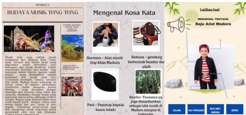
Gambar 2. LKS BIPA bermuatan budaya tong-tong

Pada kegiatan membaca dengan topik materi kearifan budaya Sumenep yakni musik tong-tong. Musik tong-tong adalah musik tradisional dari Madura. Pada kegiatan membaca, mahasiswa BIPA diajak mengenal kosa kata bahasa Indonesia yang berkaitan dengan alat musik dan baju adat Madura. Mahasiswa BIPA pada kegiatan membaca tersebut, diajak untuk mencocokkan kosa kata dan gambar.