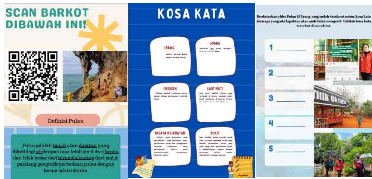
Gambar 1. LKS BIPA bermuatan wisata Pulau Kesehatan

dunia setelah Yordania. Pemilihan materi pulau Giliyang bagi peneliti dianggap menarik karena wisatawan asing yang datang ke Indonesia banyak menyukai pantai. Sehingga materi pariwisata dalam kegiatan pembelajarna pertama adalah tentang keindahan pulau kesehatan yang terdapat di Sumenep. Topik yang menarik bertujuan untuk menambah keingintahuan dan semangat pembelajar BIPA. Topik menarik yang disukai akan memunculkan rasa keingin tahuan dalam proses pembelajaran. Pada kegiatan pemebelajaran , mahasiswa BIPA diajak mengenal kosa kata dan menyimak serta menemukan kosa kata tidak dimengerti untuk didiskusikan bersama.