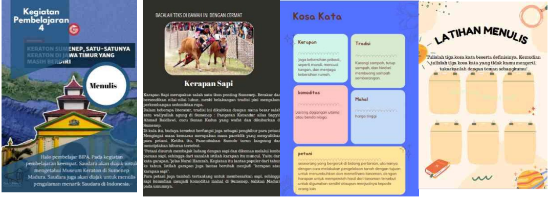
Gambar 4. LKS BIPA bermuatan materi kerapan sapi

Pada kegiatan pembelajaran 4 yakni menulis, topik yang dipilih oleh peneliti adalah museum keraton di Sumenep dan budaya kerapan Sapi di Madura. Topik Kerapan Sapi dipilih karena topik ini dirasa cocok untuk mahasiswa BIPA karena mengandung nilai-nilai luhur kearifan budaya Sumenep. Menurut Juhari (2016), kerapan sapi mempunyai nilai-nilai religius Syeik Ahmad Baidawi.