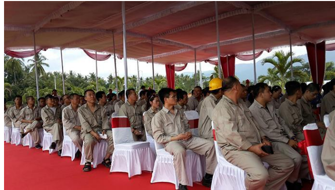
Gambar 1. Sejumlah pekerja Asal Tiongkok

oleh perusahaan PLTU pada umumnya bekerja sebagai satpan dan cleaning service dan masih sangat sedikit yang diangkat menjadi teknisi. Hal ini tentunya dapat menimbulkan kecemburuan sosial bagi masyarakat lokal sekitar, karena tenaga asing yang didatangkan untuk bekerja di PLTU celukan bawang cukup banyak dan melampaui tenaga kerja lokal.