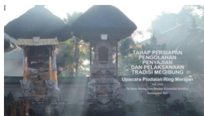
Gambar 2. Sampul video Tahap Persiapan, Pengolahan, Penyajian, Dan Pelaksanaan Tradisi Megibung Di Desa Besakih