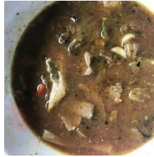
Gambar 9. Kuah Trengtengan