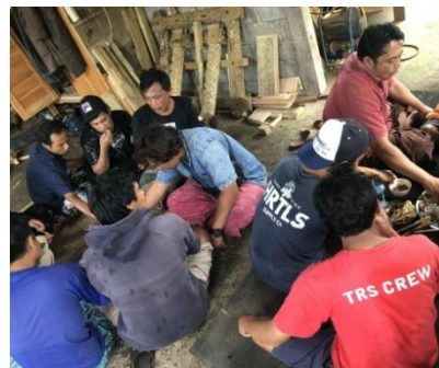
Gambar 11. Pelaksanaan megibung

Peserta megibung terdiri dari 8 (delapan orang). Setiap peserta diberikan kebebasan untuk bergabung dengan kelompok ( sele ) mana saja yang diinginkan. Setelah hidangan selesai disajikan, peserta megibung dipersilahkan untuk duduk dengan kelompoknya ( sele ) masing-masing. Penataan tempat duduk dalam megibung , diatur dengan cara lesehan, posisi duduk melingkar dan etika tangan kanan menghadap gibungan .