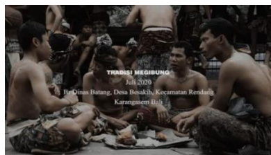
Gambar 1. Sampul video Tradisi Megibung Di Desa Besakih