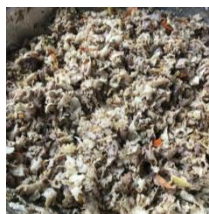
Gambar 5. Lawar Gecok