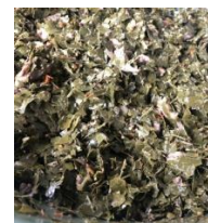
Gambar 7. Lawar Belimbing