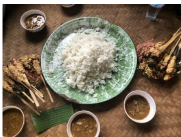
Gambar 10. Penyajian hidangan megibung

Setelah hidangan utama dan lauk pauk selesai ditata, selanjutnya dilakukan penyajian hidangan megibung . Setiap hidangan megibung terdiri dari satu (1) gibungan dan dua (2) hidangan lawar yang disajikan di kanan dan kiri gibungan . Selain itu, juga disediakan air minum yang diletakkan di setiap kelompok ( sela ), serta menyiapkan air dalam baskom untuk mencuci tangan.