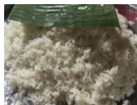
Gambar 3. Nasi