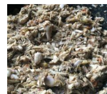
Gambar 8. Lawar Nangka