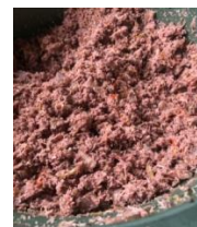
Gambar 6. Lawar Anyang

ditambahkan sambel mba lalu dicampur menjadi satu ( Ngelawar ).