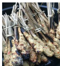
Gambar 4. Sate lilit/sate gede