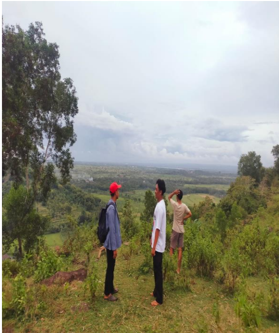
Gambar. 01 Destinasi Gunung/Bukit Tele

Aspek Attraction pada objek wisata Bukit Tele memiliki potensi alami dan buatan diantaranya dapat berupa keindahan sunset yang disukai wisatawan lokal Desa Pengembur, dengan luasnya lokasi bukit juga dimanfaatkan sebagai tempat berkemah atau camping. Aspek Accsesbility Bukit Tele dijangkau dengan semua jenis kendaraan, akses jalan sudah di aspal namun untuk sampai ke tempat wisata akses jalannya masih rusak, wisatawan yang ingin berkunjung ke bukit ini dapat menempuh perjalanan kurang lebih selama 15 menit dengan jarak 8 KM dari bandara internasional Lombok. Aspek Amenity pada objek wisata sudah terdapat berbagai sarana dan prasarana yang mendukung kunjungan wisatawan seperti sudah ada warung makan atau tempat makan yang menjual makanan khas Lombok, sudah terdapat masjid atau tempat ibadah bagi masyarakat muslim, dan toilet umum. Aspek Anccilary pada objek wisata Bukit Tele berupa keorganisasian atau lembaga yang mendukung tempat wisata sebagai wisata desa sudah tersedia seperti adanya tourist information, travel agent, dan stackeholder . 2) Gua Saung menjadi attraction alami di Desa Pengembur. Para tokoh adat memberi informasi bahwa Gua saung