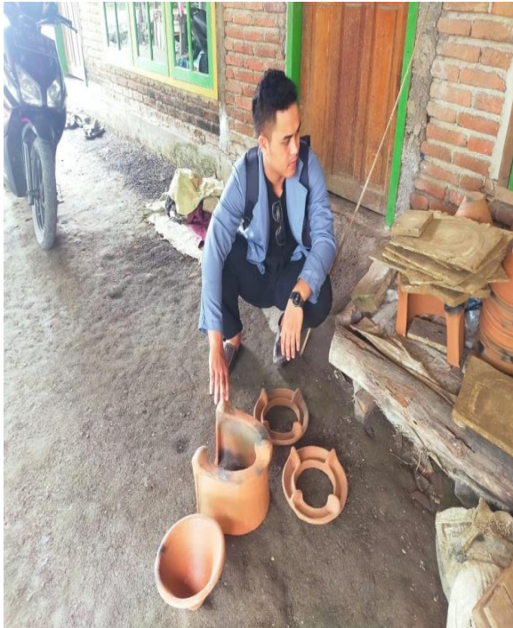
Gambar 04. Kerajinan Gerabah

Aspek Attraction pada objek wisata ini yakni adanya kegiatan pembuatan gerabah secara langsung yang dapat dilakukan oleh wisatawan, sehingga wisatawan yang datang dapat mengetahui bagaimana proses pembuatan, cara pembuatan, alat dan bahan yang dapat digunakan serta lama proses pembakaran untuk menjadi sebuah gerabah. Aspek Accsesbility pada objek wisata juga terbilang bagus, sudah ada rambu petunjuk jalan, lampu penerangan serta akses jalan yang sudah di aspal sehingga dapat memudahkan kunjungan wisatawan. Aspek Amenity objek wisata juga sama dengan objek wisata di desa Pengembur yakni sudah memadai dengan adanya toilet umum, tempat parkir, serta adanya sarana prasaran pendukung lainnya seperti adanya warung-warung tempat makan. Aspek Ancillary pada objek wisata juga sudah terdapat organisasi atau kelembagaan yang mendukung potensi wisata untuk dikembangkan menjadi desa wisata. Dengan adanya tourist information , stakeholder , travel agent , tokoh pemuda, tokoh budaya serta tokoh masyarakat maka diharapkan dapat berperan aktif dalam mendukung objek wisata di desa Pengembur untuk dikembangkan menjadi desa wisata.