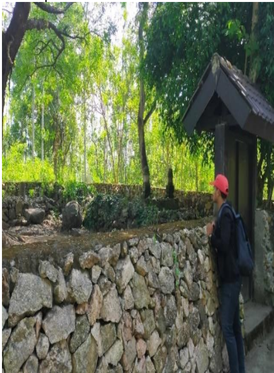
Gambar 03. Tapak Silah Batu Siledenden

Adapun potensi wisata buatan yakni, 1) Makam Siledenden. Tapak Silah Batu Siledenden merupakan sebuah bukit yang dinamakan bukit batu yang berada di dusun Bunmas Desa Pengembur. Sama halnya dengan Gua Saung yang memiliki sejarah, di makam batu Siledenden juga merupakan objek wisata yang memiliki potensi untuk dapat dikembangkan. Batu siledenden terdapat dua makam berdampingan. Makam yang satu dilengkapi batu nisan mirip menhir dan satu lainnya diberi nisan berbentuk kubah masjid. Bukan hanya makam saja yang menjadi fokus objek wisata akan tetapi pemandangan alam sekitarnya juga begitu asri. Selain kegiatan ziarah makam, adanya situs bersejarah yang ada di makam Siledenden memberikan dampak positif terhadap kehidupan sosial.