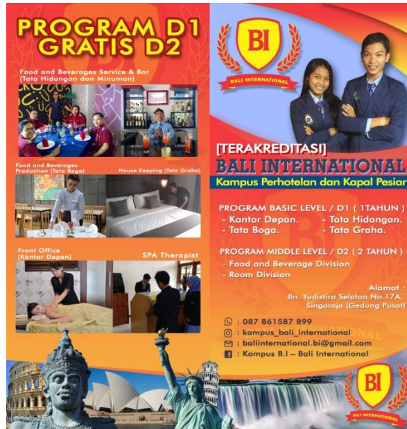
Gambar 13. Tampilan Leaflet Depan