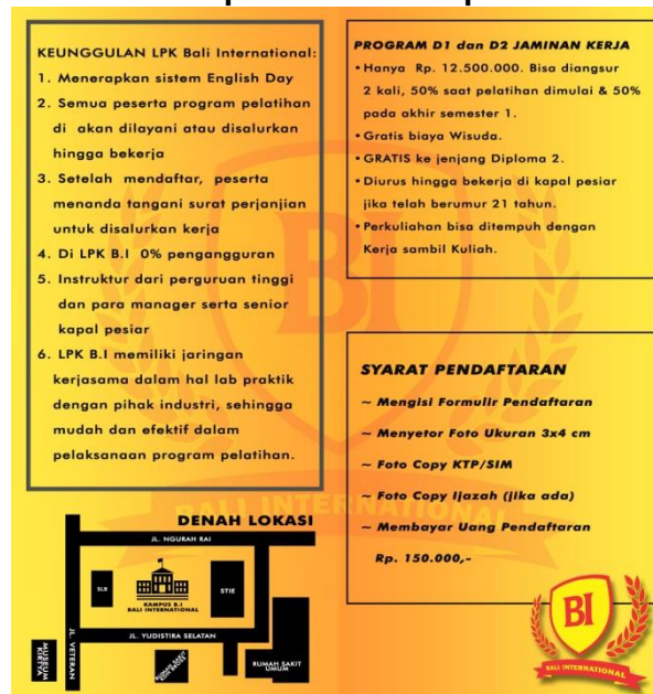
Tampilan Leaflet Belakang

Leaflet ini dirancang dengan ilustrasi menarik dengan menampilkan logo Bali International, mahasiswa Bali International, dan beberapa objek wisata terkenal. Brosur juga dilengkapi dengan informasi tentang promosi sekolah Bali International.