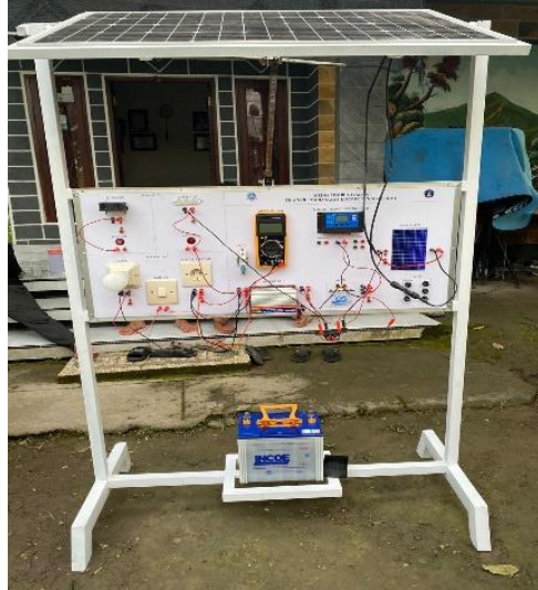
Gambar 3. Hasil Media Pengembangan

pembuatan media pembelajaran dengan sesuai desain yang sudah di setujui. Hasil pembuatan alat media pembelajaran mendapat hasil seperti gambar di bawah :