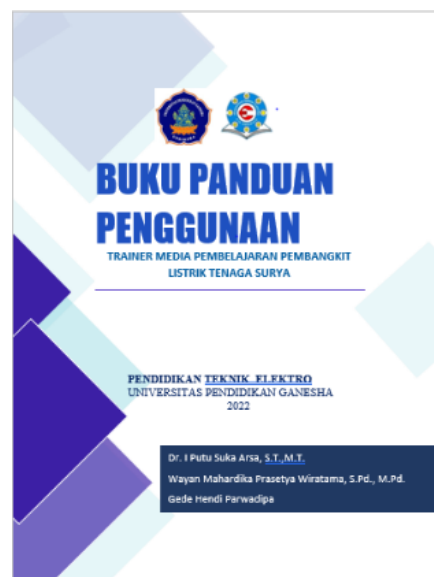
Gambar 3. Desain sampul buku panduan

Buku panduan merupakan petunjuk dan lain lain yang menjadi petunjuk tuntuna bagi pembaca untuk mengetahui sesuatu secara lengkap tentang media pembelajaran yang dibuat yang dirangkum dalam buku. Buku panduan ini akan membantu mahasiswa dalam penggunaan media pembelajaran dengan desain buku panduan media pembelajaran seperti gambar 3.