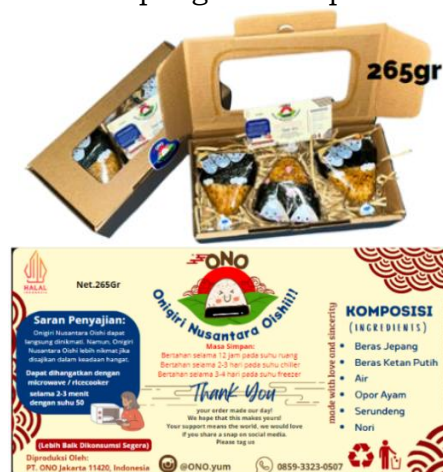
Gambar 3. Label dan Packaging ONO (Onigiri Nusantara Oishi)