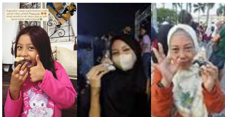
Gambar 2. Dokumentasi Pembeli