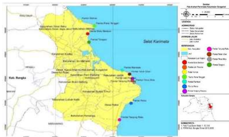
Gambar 2. Peta Arahan Pariwisata Kecamatan Sungailiat

Dalam rencana Kawasan Strategis Pariwisata (KSP) Kabupaten Bangka disebutkan bahwa Pantai Matras termasuk ke dalam KSP yang dilihat dari sudut kepentingan ekonomi. Hal tersebut didukung oleh rencana peningkatan penyediaan fasilitas pariwisata, prasarana pariwisata dan prasarana transportasi. Potensi wisata Kabupaten Bangka terdiri dari wisata alam, budaya dan minat khusus. Bangka terkenal dengan wisata pantainya yang indah, sehingga kebanyakan masyarakat Bangka menyebut “Bangka adalah Kota Seribu Pantai”. Potensi wisata alami pantai tersebut antara lain Pantai Matras, Pantai Parai Tenggara, Pantai Teluk Uber, Tanjung Pesona, serta Romodong, Penyusuk yang ada di Kecamatan Belinyu dapat dilihat pada Gambar 2 .