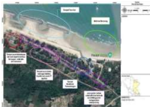
Gambar 3. Peta Aktivitas Pantai Matras

Keberadaan taman bermain anak-anak merupakan aktivitas wisata yang memiliki daya tarik tersendiri bagi obyek wisata ini. Taman bermain anak yang dilengkapi dengan berbagai sarana permainan anak menjadikan taman bermain anak dilokasi ini selalu menjadi tujuan anak-anak, taman bermain anak ini dilengkapi dengan beberapa sarana permainan anak seperti jungkat-jungkit, perosotan, rumah-rumahan, dan ayunan tetapi pada kondisi eksisting kondisi dari taman bermain dalam kondisi yang tidak baik. Selain itu pengunjung juga dapat melakukan aktivitas wisata pantai seperti berenang yang dilengkapi fasilitas penyewaan ban/pelampung, aktivitas fotografi dan juga dapat menikmati pemandangan alam Pantai Matras, serta pengunjung juga dapat mengelilingi dan menikmati keindahan pantai di sekitar kawasan Pantai Matras dengan menggunakan jasa angkutan berupa odong-odong, andong atau berkuda. Pengunjung biasanya juga sering membawa makanan yang dimakan bersama di tepi Pantai Matras atau biasanya pengunjung bisa menyewa fasilitas gazebo untuk tempat makan bersama keluarga sambil menikmati pemandangan Pantai Matras. (RIPPARDA Kabupaten Bangka Tahun 2017). Aktivitas-aktivitas yang ada di Pantai Matras dapat dilihat pada Gambar 3 .