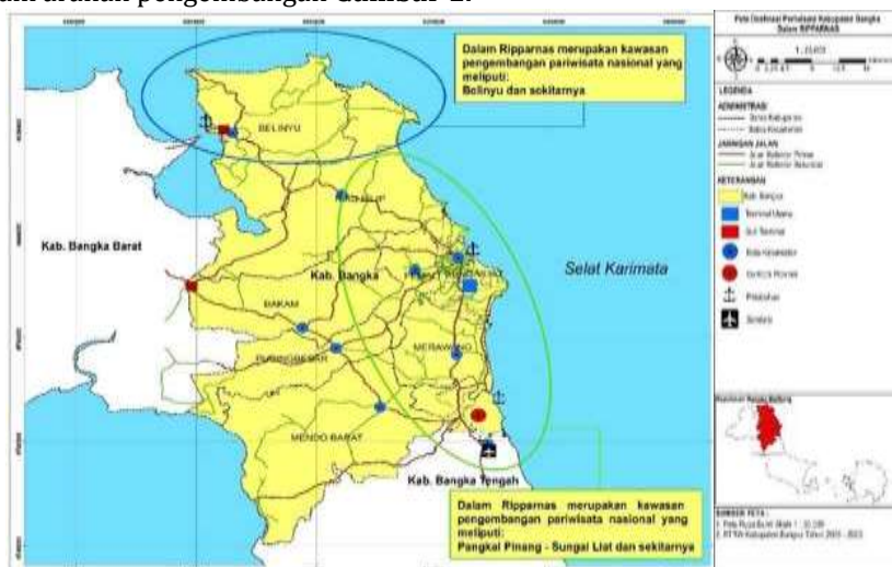
Gambar 1. Peta Kawasan Pengembangan Pariwisata Nasional, Pangkalpinang-Sungailiat

Dalam RIPPARNAS, kepariwisataan Kabupaten Bangka diatur dalam arahan pembangunan destinasi pariwisata, khususnya arahan perwilayahan destinasi pariwisata. Arahan perwilayahan destinasi pariwisata nasional menetapkan Kabupaten Bangka dalam Destinasi Pariwisata Nasional (DPN) Palembang – Bangka Belitung dan sekitarnya. DPN ini terdiri dari tiga Kawasan Pengembangan Pariwisata Nasional (KPPN) dan dua Kawasan Strategis Pariwisata Nasional (KSPN). Dalam RIPPARNAS juga disebutkan bahwa Kawasan Pengembangan Pariwisata Nasional (KPPN) yaitu meliputi Pangkalpinang-Sungailiat dan sekitarnya, yang dimana Pantai Matras berada di Kecamatan Sungailiat dan Pantai Matras termasuk ke dalam arahan pengembangan Gambar 1 .