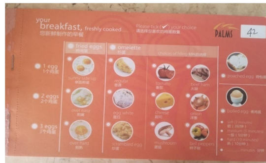
Foto 2 Egg Pad

Di Palms Restaurant para tamu dapat memesan telur dengan menggunakan eggpad / kertas menu khusus berbagai macam omelette dengan beberapa topping, fried egg , poached egg dan boil egg . Tamu yang pertama kali datang atau melakukan breakfast untuk pertama kalinya di Palms Restaurant merasa bingung masalah penggunaan egg pad sehingga terkadang terjadi kesalahan pemesanan karena ketidak pahaman tamu.