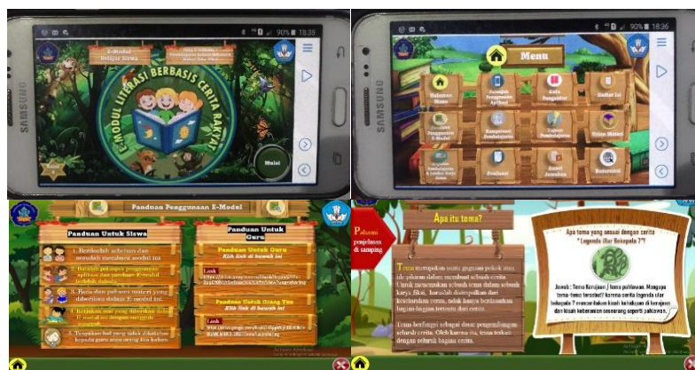
Gambar 1. Tampilan layar dan Isi dari E-Modul

Hasil penelitian ketiga berkaitan dengan tahap development , yang dilakukan dengan mengembangkan media sesuai rancangan yang telah disusun. Tahap pengembangan produk mulai dari membuat tampilan layar e-modul, menambahkan materi pada e-modul, menambahkan interaktivitas pada e-modul, menambahkan soal dan evaluasi pada e-modul, membuat kunci jawaban pada e-modul, mendesain logo e-modul, mengubah power point menjadi HTML, mengubah HTML menjadi aplikasi, instalansi e-modul yang dikembangkan, membuat angket validitas produk. Sehingga pada tahap ini akan terciptanya sebuah produk dalam bentuk nyata, kemudian produk yang sudah selesai didiskusikan terlebih dahulu bersama pembimbing. Setelah itu, produk siap untuk divalidasi oleh pakar ahli meliputi pakar isi mata pelajaran, pakar desain pembelajaran dan pakar media pembelajaran. Berikut adalah hasil tampilan dari e-modul literasi berbasis cerita rakyat. Adapun tampilan media yang dikembangkan disajikan pada Gambar 1.