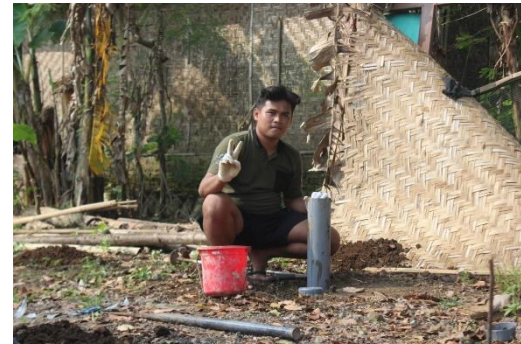
Gambar 9. Proses memasukkan LRB kedalam tanah