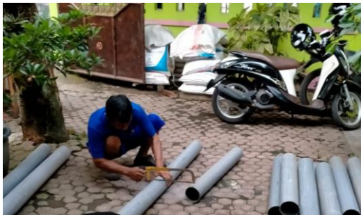
Gambar 6. Proses pembuatan LRB