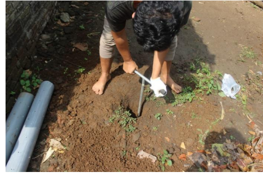
Gambar 8. Proses pembuatan lubang tanah menggunakan alat biopori