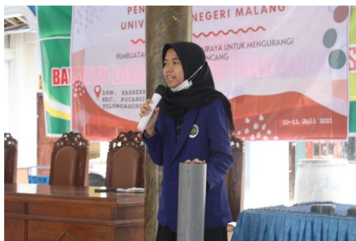
Gambar 2. Proses sosialisasi