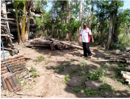
Gambar 5. Penentuan titik pemasangan LRB

menjadi tempat peletakan LRB. Tanah dilubangi dengan jarak antar lubang 1 meter dan kedalaman 80 cm.