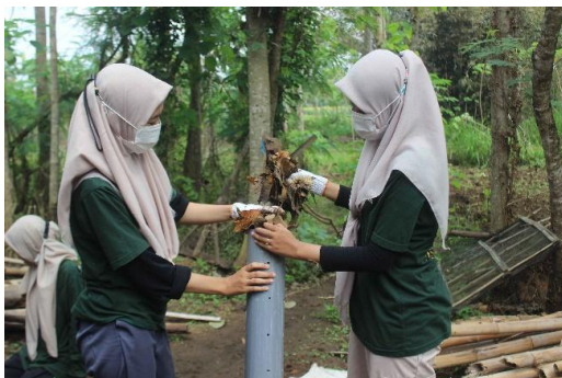
Gambar 7 Proses memasukkan sampah organik kedalam LRB