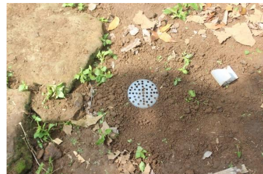
Gambar 10. LRB setelah berhasil ditanam di dalam tanah