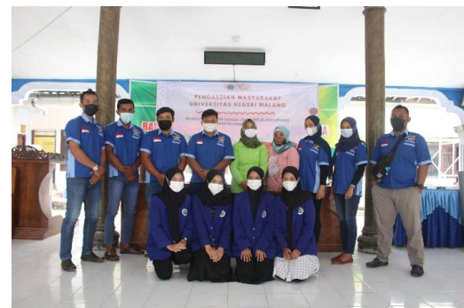
Gambar 4. Dokumentasi kelompok pelaksana bersama karang taruna dan pemerintah Desa Demuk

Tahapan keempat yaitu proses pembuatan pipa LRB. Proses pembuatan LRB dimulai dengan memotong pipa yang memiliki diameter 10 cm dengan panjang 80 cm. Setelah pipa dipotong, pipa diberi lubang kecil-kecil atau pori-pori dengan jarak antar lubang 5 cm. Selain memberikan pori-pori atau lubang pada pipa, tutup pipa juga wajib diberi lubang dengan pola melingkar dan jarak antar lubang \frac{1}{2} cm.