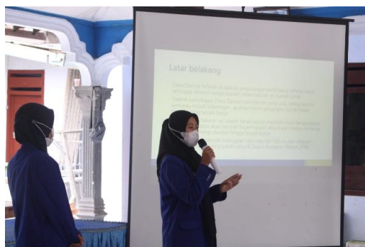
Gambar 3. Pengenalan LRB

Tahapan keempat yaitu proses pembuatan pipa LRB. Proses pembuatan LRB dimulai dengan memotong pipa yang memiliki diameter 10 cm dengan panjang 80 cm. Setelah pipa dipotong, pipa diberi lubang kecil-kecil atau pori-pori dengan jarak antar lubang 5 cm. Selain memberikan pori-pori atau lubang pada pipa, tutup pipa juga wajib diberi lubang dengan pola melingkar dan jarak antar lubang \frac{1}{2} cm.