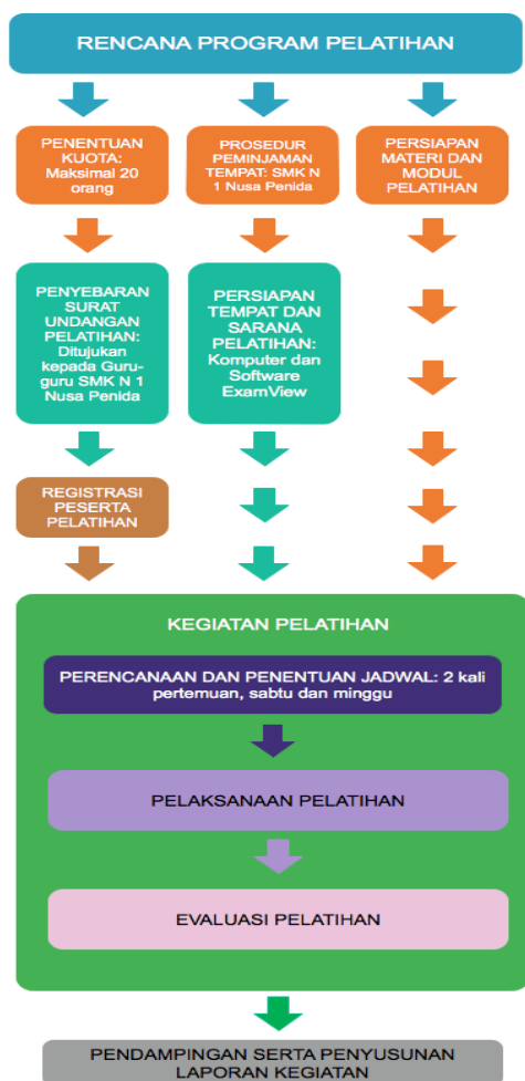
Gambar 2 Kerangka pelaksanaan program

Evaluasi dilakukan sebagai rangkaian akhir dari pelaksanaan kegiatan. Namun pada prinsipnya kegiatan evaluasi dilakukan secara simultan, yaitu: evaluasi dilakukan secara bersamaan selama berlangsungnya kegiatan pelatihan dan pendampingan.