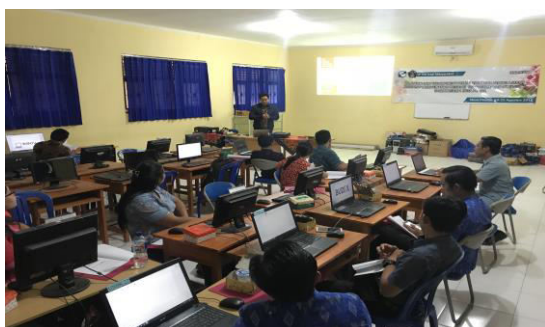
Gambar 3 Pemaparan overview aplikasi ExamView oleh Pemateri

Kegiatan selanjutnya adalah pemaparan overview dari aplikasi ExamView oleh pemateri. Pemateri memiliki kualifikasi S2 Teknik Informatika. Pemaparan meliputi pemaparan kewajiban guru tentang kegiatan menilai dan mengevaluasi hasil pembelajaran yang diatur dalam Undang-Undang Republik Indonesia Nomor 14 Tahun 2005 Pasal 20 Ayat (a), pentingnya adopsi teknologi di era revolusi industri 4.0, penggunaan aplikasi berbasis teknologi pengelolaan bank soal, pengenalan aplikasi ExamView , dan fitur-fitur aplikasi ExamView . Pemaparan ditunjukkan pada Gambar 3.