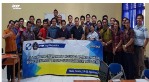
Gambar 9 Kegiatan foto bersama

Kegiatan pelatihan berlangsung selama 4 jam dan menghasilkan produk berupa bank soal, dan hasil cetak dari lembar soal, lembar jawaban, dan lembar kunci jawaban. Hal ini menandakan meningkatnya keterampilan peserta dalam pengelolaan bank soal. Gambar 9 merupakan kegiatan foto bersama tim pelaksana, pemateri, instruktur dan peserta.