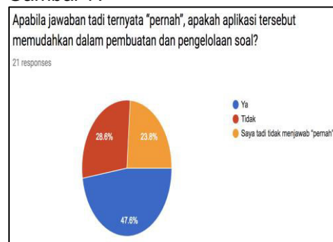
Gambar 7 Hasil pre-test butir teknologi tepat guna

Hasil yang didapat dari pre-test dan post-test selain peningkatan pengetahuan adalah ditemukannya penggunaan aplikasi yang tidak tepat guna dalam penyusunan soal dalam pembuatan instrumen penilaian. Aplikasi tersebut adalah aplikasi pengolah kata yang sering digunakan yakni Microsoft Word. Sebanyak 6 orang (28,6%) menjawab aplikasi tersebut tidak membantu seperti pada Gambar 7.