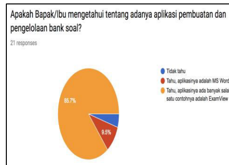
Gambar 6 Hasil post-test butir pengetahuan

Hasil yang didapat dari pre-test dan post-test selain peningkatan pengetahuan adalah ditemukannya penggunaan aplikasi yang tidak tepat guna dalam penyusunan soal dalam pembuatan instrumen penilaian. Aplikasi tersebut adalah aplikasi pengolah kata yang sering digunakan yakni Microsoft Word. Sebanyak 6 orang (28,6%) menjawab aplikasi tersebut tidak membantu seperti pada Gambar 7.