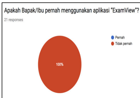
Gambar 5 Hasil pre-test butir penggunaan ExamView