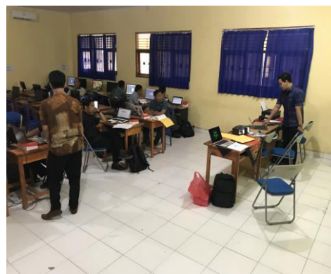
Gambar 10 Kegiatan pada tahap Pendampingan

Kegiatan pendampingan dilaksanakan pada hari Sabtu, tanggal 25 Agustus 2018 yang dihadiri oleh 21 peserta guru-guru SMK N 1 Nusa Penida. Kegiatan dilaksanakan Pukul 08.00 WITA yang berlangsung di Laboratorium Multimedia. Pendampingan meliputi diskusi dan tanya jawab terkait pengalaman mereka menggunakan aplikasi ExamView . Di akhir kegiatan pendampingan, dilakukan pengambilan respon terkait pelaksanaan pelatihan dan pendampingan. Hasil yang didapat adalah sebagian besar peserta merasa terbantu akan adanya aplikasi ExamView . Peserta berharap pelatihan serupa dilaksanakan pada kesempatan berikutnya. Kegiatan pendampingan dapat ditunjukkan pada Gambar 10.