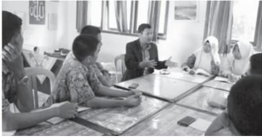
Gambar 3. Suasana sesi konsultasi

Sesi konsultasi membantu peserta untuk dapat mempersiapkan diri beradaptasi terhadap perubahan yang akan terjadi pada dunia kerja di era digital. Individu yang adaptif akan menunjukkan kekhawatiran tentang masa depan mereka, meningkatkan kontrol yang mereka miliki atas masa depan mereka, ingin tahu tentang diri mereka di masa depan, dan mendapatkan kepercayaan diri untuk mengejar aspirasi mereka (Savickas, 2005)