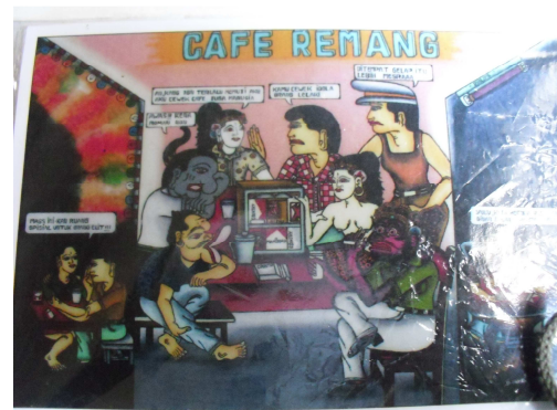
Gambar 5: Lukisan Kaca Kontenporer

Untuk manajemen usaha, Ipteks telah diberikan pembinaan meliputi: pembukuan, penguasaan teknologi komputer dan sistem informasi Internet. Di samping itu juga diberikan peningkatan manajemen pemasaran baik lokal maupun global. Untuk pemasaran global, Ipteks yang diberikan kepada mitra adalah pembuatan website atau