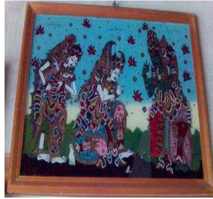
Gambar: 2. Sang Rama, Laksmana, dan Dewi Sita