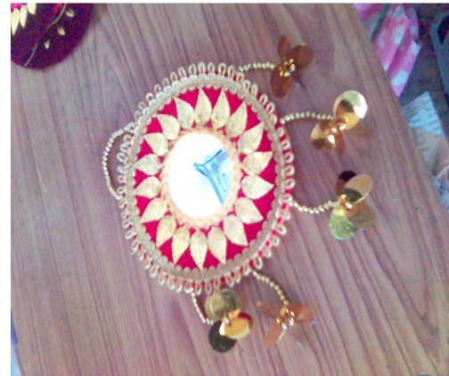
Gambar 4: Saab mote Dekoratif