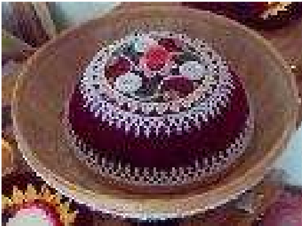
Gambar 3: Saab mote dengan wadahnya