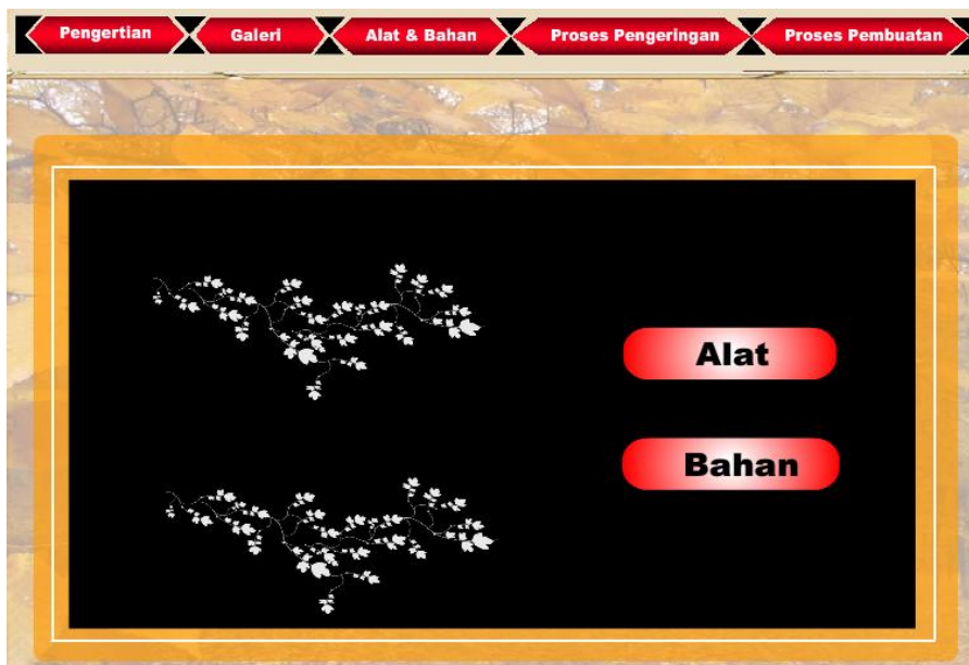
Gambar 1. Tampilan Menu Alat dan Bahan

Informasi ini berisi informasi tentang alat dan bahan yang digunakan untuk membuat kerajinan. Gambar tampilan alat dan bahan seperti terlihat pada Gambar 1.