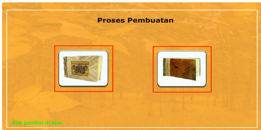
Gambar 3. Tampilan Menu Proses Pembuatan Kerajinan

Pada proses pembuatan ini berisi informasi tentang proses pembuatan kerajinan tangan dengan bahan daun kering. Adapun tampilan menu proses pembuatan kerajinan seperti terlihat pada Gambar 3.