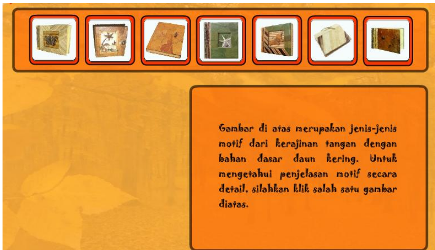
Gambar 3. Tampilan Menu Produk Kerajinan