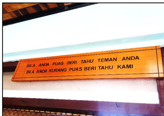
Gambar 3. Salah satu Motto di UPJ TKKY