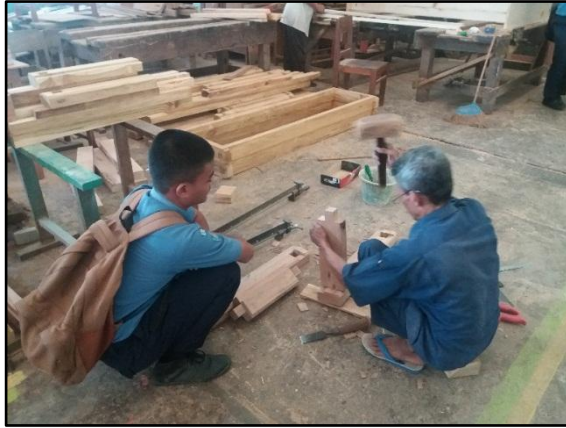
Gambar 1. Keteladanan dari Tukang UPJ TKKY