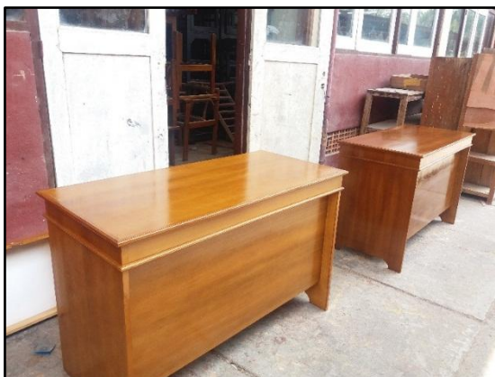
Gambar 4. Meja ½ biro hasil UPJ TKKY yang akan dipakai di SMKN 2 Pengasih