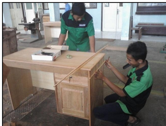
Gambar 2. Praktik Mata Pelajaran Produktif di UPJ TKKY

Pembelajaran karakter kewirausahaan dalam UPJ TKKY dilakukan melalui berbagai kegiatan yang terbagi menjadi kegiatan pembelajaran kurikuler dan kokurikuler. Pendidikan karakter kewirausahaan melalui kegiatan kurikuler dilakukan pada saat pelajaran praktik mata pelajaran produktif dan pada saat ujian mata pelajaran produktif. Pelaksanaan mata pelajaran produktif praktik kayu dilakukan melalui kerja sama dengan UPJ berupa pembuatan meja \frac{1}{2} biro, pembuatan bifet mini, pembuatan tangga kayu, pembuatan meja kursi siswa, dan pembuatan meja kursi guru. Sedangkan pada saat ujian praktik kayu juga bekerjasama dengan UPJ TKKY berupa pembuatan daun pintu, daun jendela, kosen pintu dan kosen jendela. Pada pelajaran praktik dan ujian tersebut tidak hanya dinilai tentang pengetahuan dan keterampilan dalam pembuatan produk, tetapi juga tentang sikap dalam bekerja. Pada umumnya pelaksanaan mata pelajaran praktik dan ujian tersebut dilakukan secara berkelompok dengan anggota 2 siswa/kelompok.