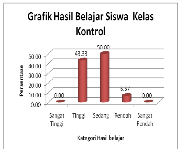
Gambar 2 Histogram Hasil Belajar TIK Kelompok Kontrol

Berdasarkan Tabel 4 didapatkan hasil belajar TIK kelompok kontrol dapat disajikan dalam histogram seperti Gambar 2.