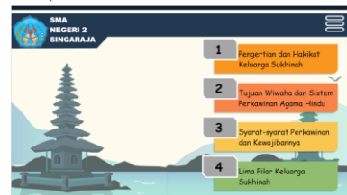
Gambar 5 Menu Materi

Pada halaman Menu Utama terdapat tiga buah menu yaitu informasi, materi dan evaluasi