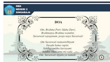
Gambar 3 Halaman Doa

Pada halaman awal user diminta untuk menekan tombol play untuk memulai menggunakan konten pembelajaran interaktif.