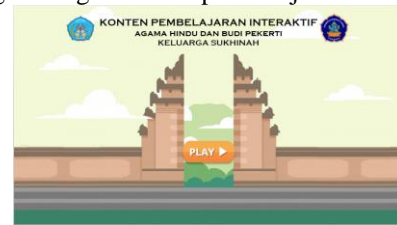
Gambar 2 Halaman Awal

gambar dan video, pemetaan layout tampilan dari setiap slide pada Articulate Storyline 3. Berikut ini merupakan hasil pengembangan konten pembelajaran interaktif.