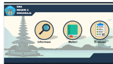
Gambar 4 Menu Utama

Sebelum memulai pembelajaran peserta didik diarahkan untuk berdoa terlebih dahulu