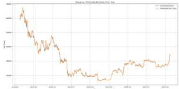
Gambar 9 Grafik Perbandingan Data Actual dan Prediksi

menggunakan data aktual dan prediksi memiliki garis yang hampir mirip hasil grafik dapat ditunjukkan seperti gambar 9.