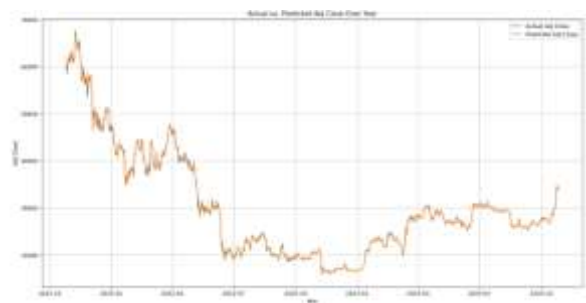
Gambar 8 Hasil Grafik Perbandingan

Visualisasi yang ditampilkan berbentuk tabel dan grafik garis (line plot). Dalam grafik ini, sumbu-x (horizontal) mewakili tanggal (Date), sementara sumbu-y (vertikal) mewakili nilai dari kolom "Adj Close" bentuk garafik tersebut dapat dilihat pada gambar dibawah.