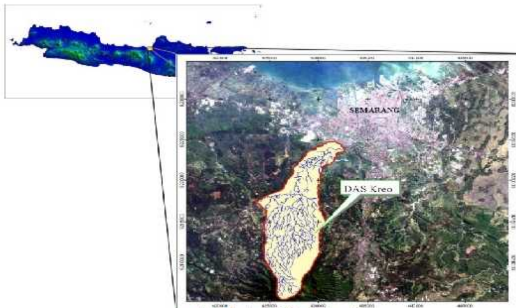
Gambar 1. Lokasi Wilayah Penelitian