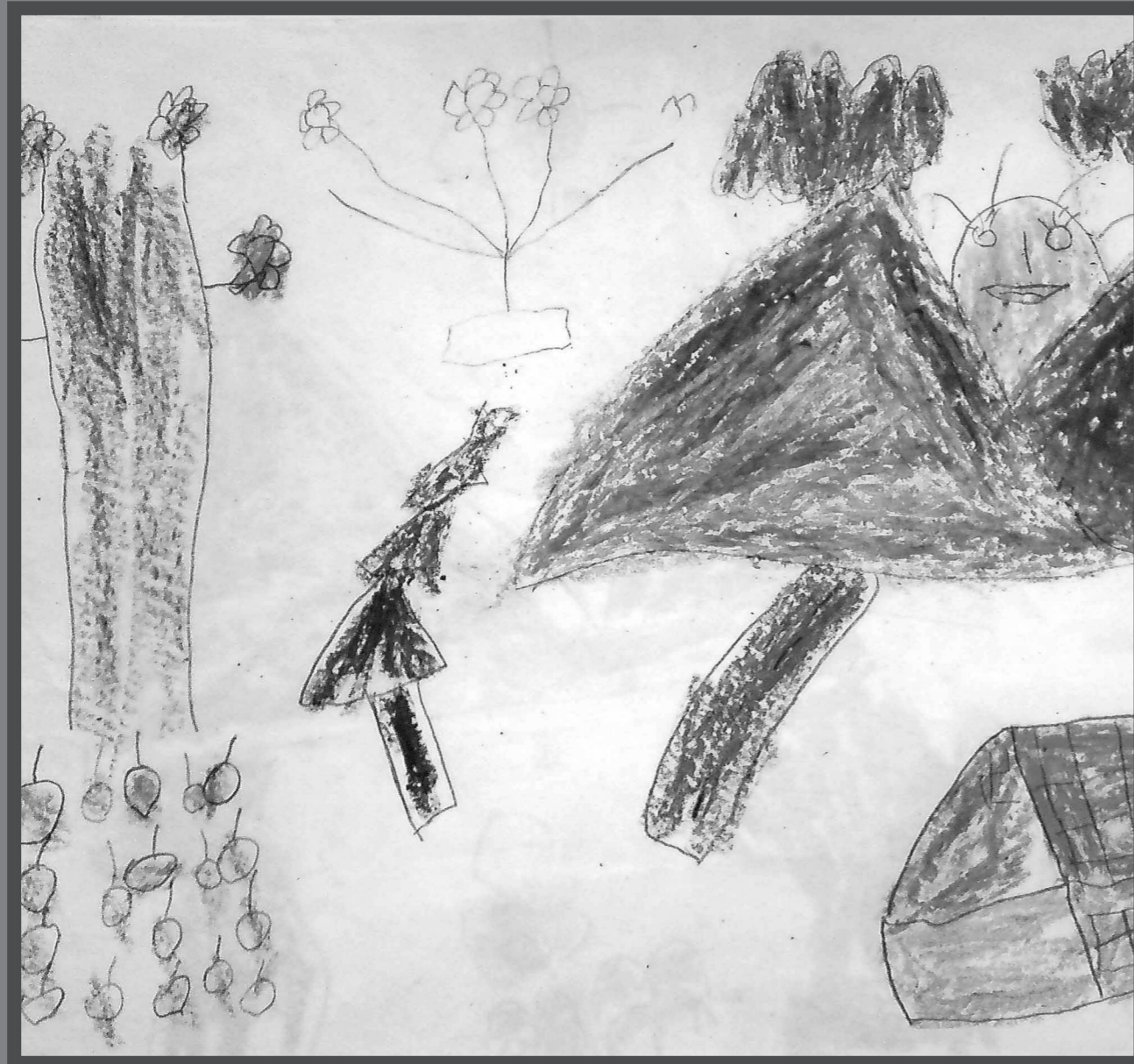
Gunung Kembar Karya Vidia (5 tahun 6 bulan) 2008