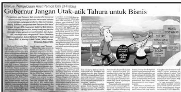
Gambar 4. Gambar sosok menyerupai tikus.

Ikon tikus seperti pada subjudul ini, dapat ditemukan pada banyak media masa yang memberitakan perihal korupsi atau perilaku yang merugikan bagi orang lain, baik dalam skala kecil atau besar. Contohnya saja pada pemberitaan dalam koran Bali Post, Sabtu, 26 Juni 2013 (lihat gambar 4), yang menyinggung masalah pemerintah daerah yang seenaknya menjual aset daerah tanpa mempertimbangkan dampak yang akan ditimbulkan bagi masyarakat daerah tersebut.