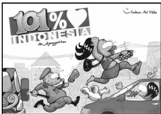
Gambar 1. Sampul Depan Komik 101% ♥ Indonesia

tar belakang pendidikan formal tentang komik, yang justru merupakan seorang sarjana dibidang arsitektur. Meskipun demikian komik 101% ♥ Indonesia mendapatkan tempat khusus di hati pembacanya, ini dibuktikan dengan diberikannya apresiasi positif oleh komikus terkenal, Beng Rahadian dan bahkan seorang sutradara ternama, yaitu Garin Nugroho.