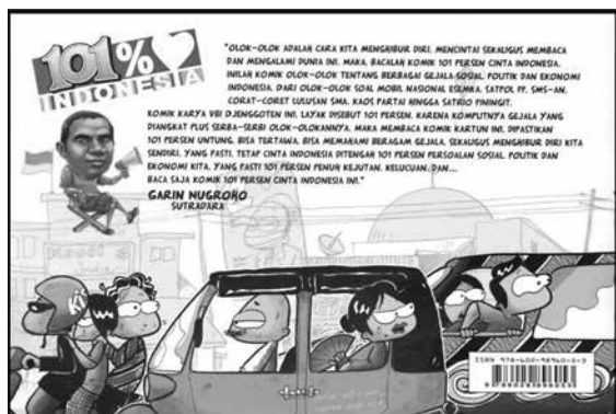
Gambar 2. Sampul Belakang Komik 101% ♥ Indonesia, Sumber : Komik 101% ♥ Indonesia (2012)

Berkaitan dengan itu, timbullah permasalahan dalam penelitian ini mengenai makna denotatif dan konotatif pada citra visual dalam komik 101% ♥ Indonesia yang dibuat oleh seorang sarjana arsitektur.