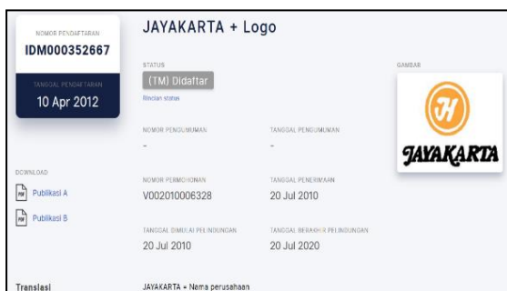
Gambar 1. Logo The Jayakarta Lombok Beach Resort & SPA terdaftar di DJKI

Jika kita melihat data secara nasional misalkan perihal brand hotel dan yang terkait dengan bidang hotel berdasarkan data dari Indonesian Trademark Database WIPO sampai dengan tahun 2022 di Indonesia baru ada sekitar 186. Di Lombok Barat Sendiri misalkan hanya ada 1 (satu) hotel yang telah terdaftar dalam database Direktorat Jenderal Kekayaan Intelektual (DJKI) dengan nomor pendaftaran IDM000352667, yaitu sebagai berikut: