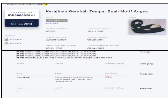
Gambar 5. Desain Industri Gerabah Angsa (Kerajinan Gerabah) atas nama Zaenudin terdaftar di DJKI Kemenkumham

Sedangkan Desain Industri Gerabah Angsa (Kerajinan Gerabah) atas nama Zaenudin pada website DJKI dengan Nomor Pendaftaran IDD000032641 Tanggal 06 Februari 2013: