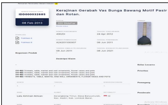
Gambar 4. Desain Industri (Vas Bunga Bawang Motif Pasir) atas nama L. Akmad Akhsan terdaftar di DJKI Kemenkumham

Sedangkan Desain Industri Gerabah Angsa (Kerajinan Gerabah) atas nama Zaenudin pada website DJKI dengan Nomor Pendaftaran IDD000032641 Tanggal 06 Februari 2013: