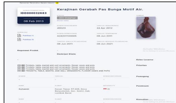
Gambar 6. Vas Bunga Motif Air) atas nama Suhaemi terdaftar di DJKI Kemenkumham